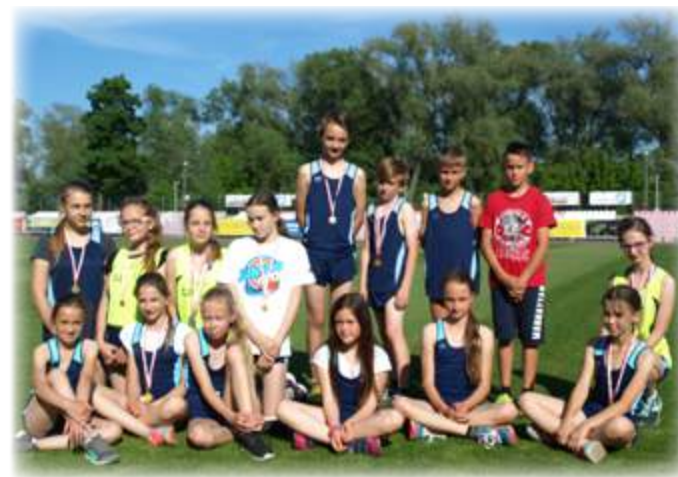
ZSP w Stawiskach