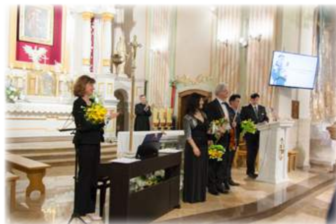
Tekst: UM Stawiski