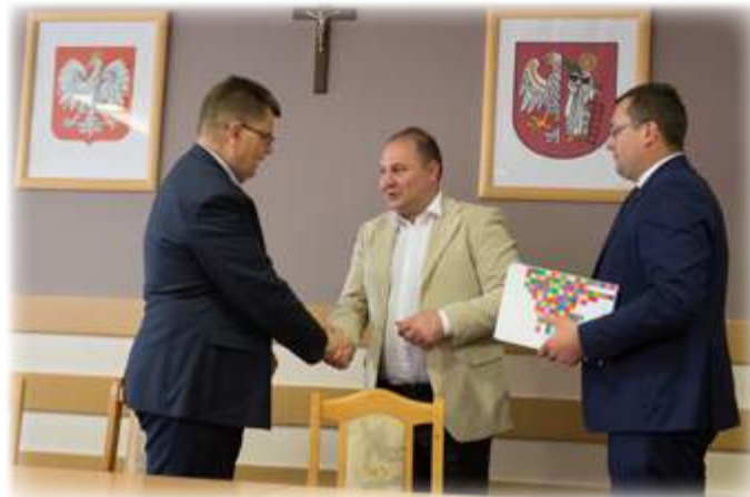
Tekst: UM Stawiski

Gmina Stawiski otrzymała 6 tys. zł dofinansowania na zakup sprzętu ratowniczo-gaśniczego dla jednostki OSP w Stawiskach, który zostanie wykorzystany do ochrony życia i mienia ludzkiego przez naszych strażaków ochotników.