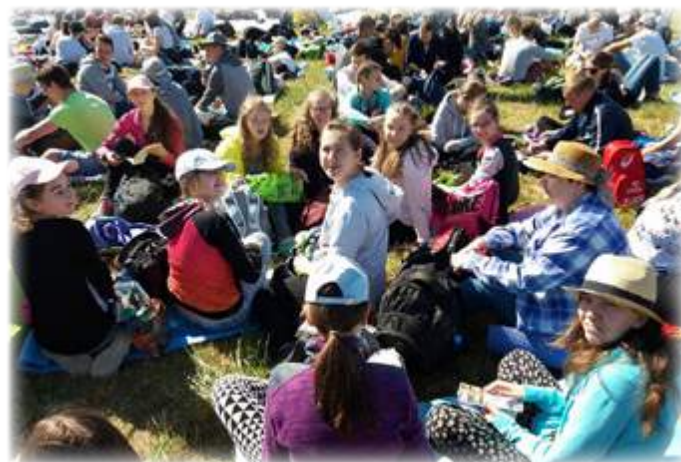
Tekst: UM Stawiski Zdjęcia: Parafia Stawiski