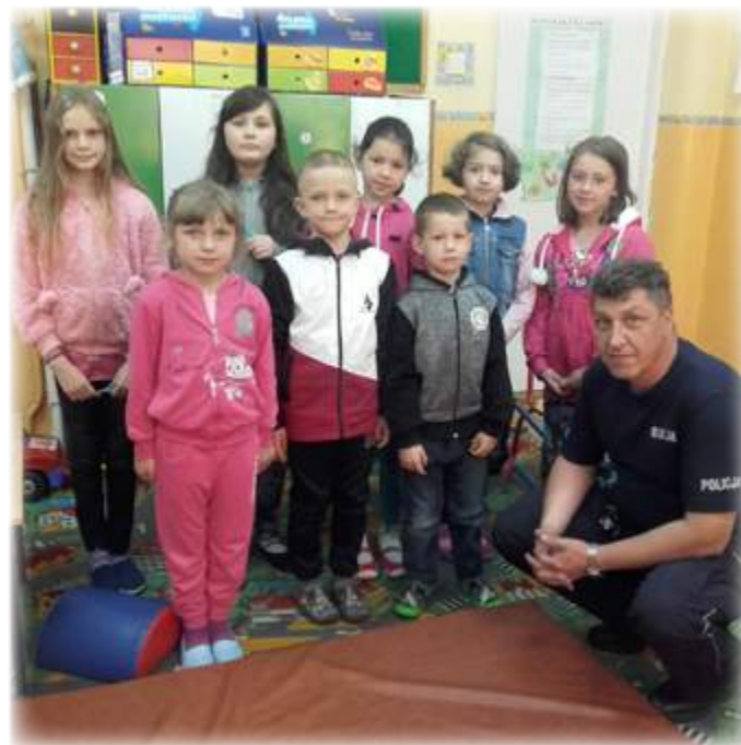
Tekst: UM Stawiski

Zważywszy na realne zagrożenie również wśród najmłodszych, 13 czerwca b.r. dzielnicowy ze Stawisk odwiedził dzieci ze Szkoły Podstawowej w Jurcu Szlacheckim. Omówił najważniejsze aspekty bezpieczeństwa, a także odpowiedniego zachowania się nad wodą.