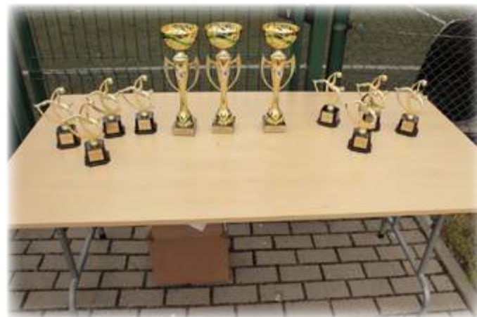
Tekst: UM Stawiski