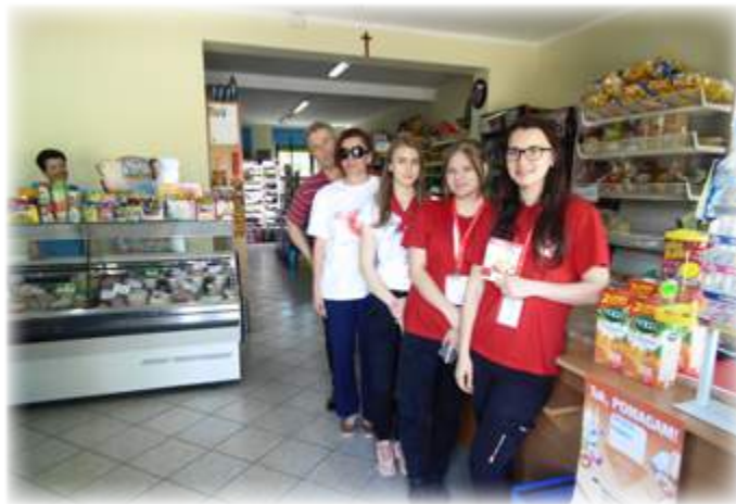
Tekst: UM Stawiski