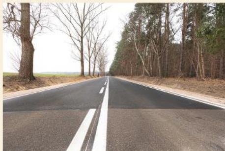
Remont drogi wojewódzkiej nr 647 Stawiski - Kolno