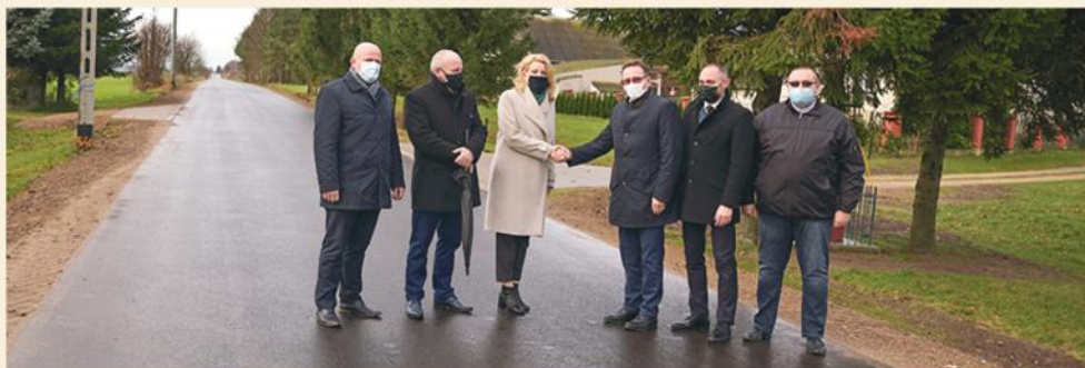
Odbiór techniczny przebudowanej drogi powiatowej Dzierzbia – Zaskrodzie

Zakończył się remont ponad 2,3 km drogi powiatowej Dzierzbia – Zaskrodzie, który był możliwy dzięki dobrej współpracy z Powiatem Kolneńskim. To inwestycja dofinansowana z budżetu Gminy Stawiski, Powiatu Kolneńskiego i Funduszu Dróg Samorządowych.