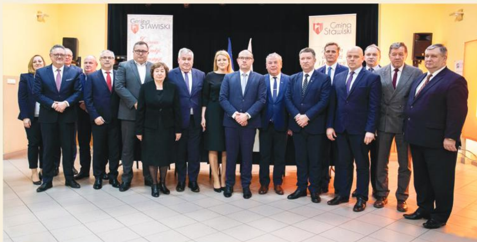
Spotkanie z Marszałkiem Województwa Podlaskiego w Stawiskach