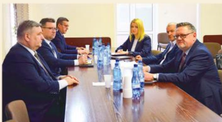
Spotkanie samorządowców w sprawie wsparcia dla Szpitala Ogólnego w Kolnie

Współpraca z innymi samorządowcami to nie tylko wspólne inwestycje drogowe, ale też rozwiązywanie szeregu innych spraw. 24 marca w nadzwyczajnym spotkaniu burmistrzów i wójtów z powiatu kolneńskiego podjęliśmy wspólną decyzję o wsparciu dla Szpitala Ogólnego. Każda z gmin przekazała szpitalowi pomoc w formie finansowej lub rzeczowej niezbędnej do jego funkcjonowania w czasie pandemii.