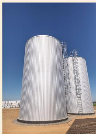
Zmodernizowana Stacja Uzdatniania Wody w Sokołach

Największą proekologiczną inwestycją w mijającym roku była ta, dzięki której na ośmiu gminnych obiektach zamontowane zostały bądź niedługo będą montowane panele fotowoltaiczne. Wartość inwestycji pn. "Instalacje OZE na potrzeby Gminy Stawiski" to 703 422,51 zł, z czego 85% pochodzi z dotacji pozyskanej z Regionalnego Programu Operacyjnego Województwa Podlaskiego na lata 2014 - 2020.