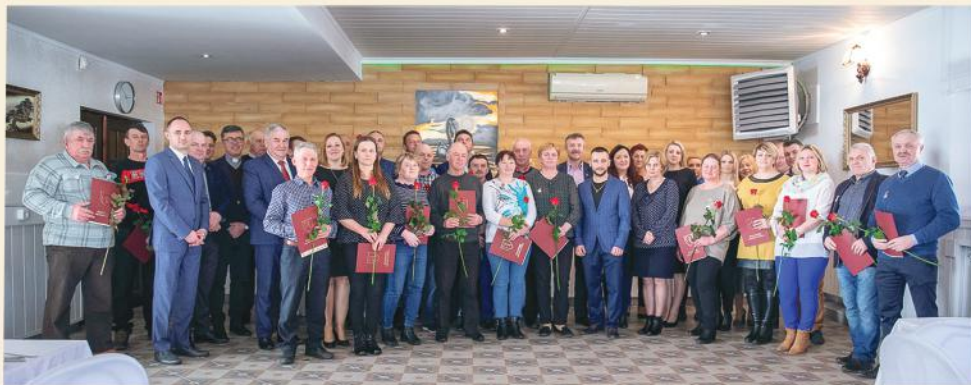
Dzień Sołtysa - 11 marca 2020 roku

Jesteśmy dumni, że firma Agrotechnik dołączyła do grona firm, które poszczycić się mogą niezwykle prestiżowym tytułem Mistrza Podlaskiej Agroligi. Rozstrzygnięcie wojewódzkiego etapu konkursu odbyło się 23 września br. w Księżynie.