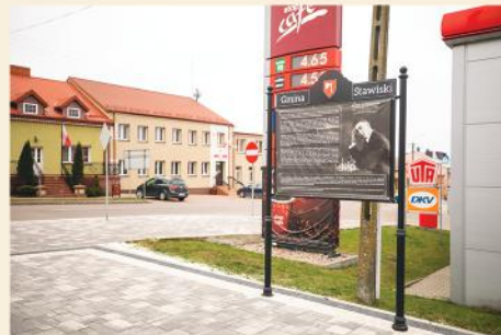
Tablice informacyjne w Parku