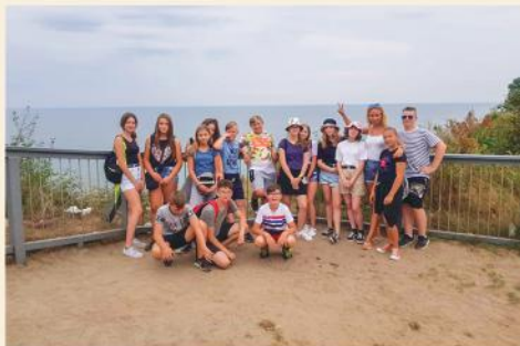
Wakacyjny wypoczynek nad morzem dzieci z Gminy Stawiski