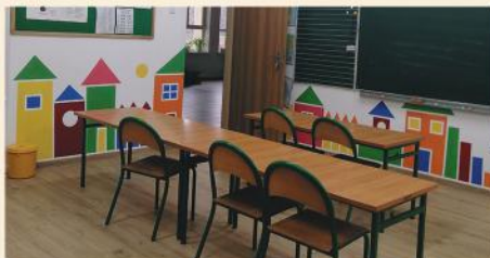
Szkoła w Stawiskach i Jurcu Szlacheckim po remoncie