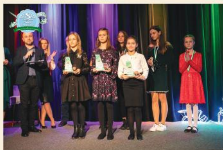
8 Przegląd Kolęd i Pastoralek