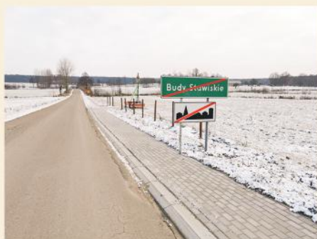
Utwardzone pobocze w Budach Stawiskich