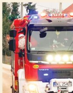
Mikołajkowe spotkania w czasach epidemii