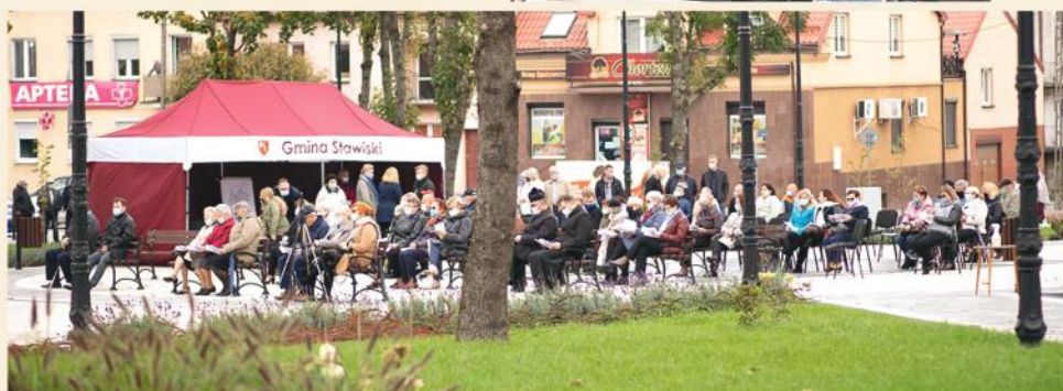
Koncert z okazji 100 rocznicy urodzin Jana Pawła II