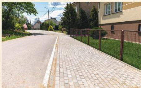
Utwardzone pobocze drogi w Ignaciewie

W 2020 r. zakończyliśmy przebudowę ulic w Stawiskach: Kościuszki i Kościelnej oraz drogi Zalesie – Karwowo. Utwardziliśmy pobocza dróg m. in. w Ignaciewie, Mieszotkach, Rogalach, Michnach, Wysokim Dużym, Budach Stawiskich oraz przeprowadziliśmy remont chodnika przy ul. Plac Wolności w Stawiskach. Wykonaliśmy zmianę organizacji ruchu i oznakowania na ul. Długiej w Stawiskach (przy Oddziale HexaBanku) tak, aby zwiększyć bezpieczeństwo ruchu drogowego i pieszego.