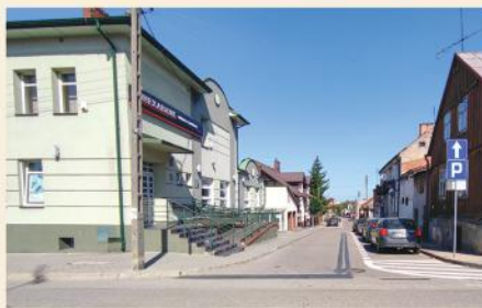
Zmiana organizacji ruchu na ulicy Długiej