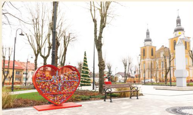
Zbieramy nakrętki w Sercu w Parku

Serce na plastikowe zakrętki, które w Parku w Stawiskach postawiliśmy pod koniec 2019 r. non stop zapełniało się zakrętkami w bieżącym roku.