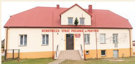
Siedziba OSP KSRG Poryte