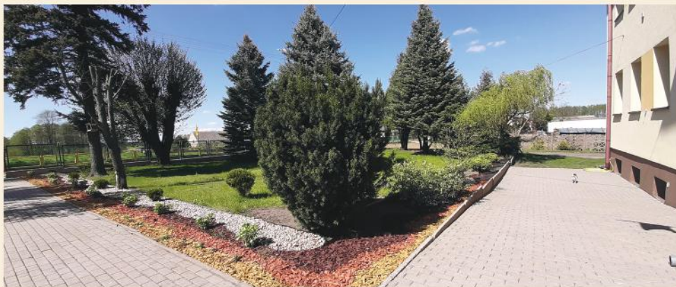
Zadbany teren wokół szkoły w Porytem