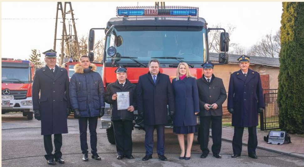
Posel na Sejm RP Jarosław Zieliński z przedstawicielami PSP oraz Prezesem WFOŚiGW i Burmistrz Stawisk podczas przekazania samochodu dla OSP Poryte

W 2020 roku jednostka OSP Poryte została włączona do Krajowego Systemu Ratowniczo – Gaśniczego, który stanowi integralną część systemu bezpieczeństwa państwa. Włączenie do tego systemu znacznie podnosi rangę jednostki i wpływa na bezpieczeństwo mieszkańców gminy.