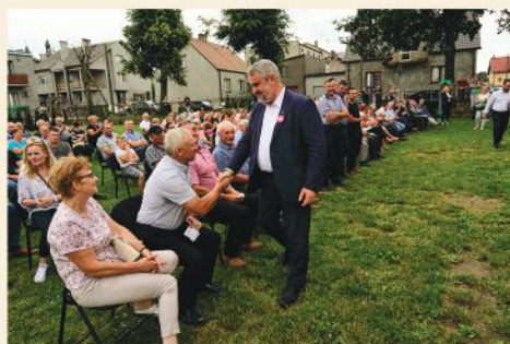
Spotkanie z przedstawicielami Rządu RP w Stawiskach