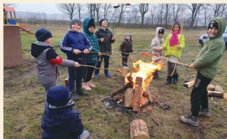
Zajęcia w trakcie ferii w świetlicy w Budach Stawiskich