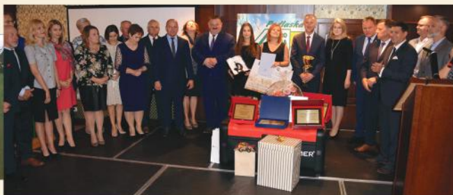
Przedstawiciele mistrzowskiej firmy Agrotechnik odbierają gratulacje z okazji zdobycia tytułu Mistrza Podlaskiej Agroligi