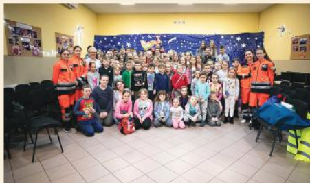
Ferie zimowe w GOKiS w Stawiskach

Ferie zimowe dla dzieci w Gminnym Ośrodku Kultury i Sportu w Stawiskach oraz w świetlicy w Budach Stawiskich odbyły się jeszcze bez przeszkód, podobnie jak 8 Przegląd Kolęd i Pastoralek, w którym udział wzięło 24. artystów w pięciu kategoriach czy fantastyczny Dzień Kobiet z tłumem gości.