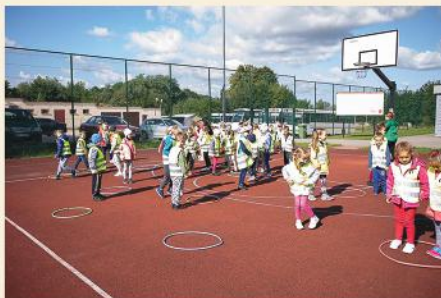
Akcja „Przedszkolaki na Orliku” w Stawiskach

20 września 2020 r. odbył się rajd rowerowy i piknik rodzinny.