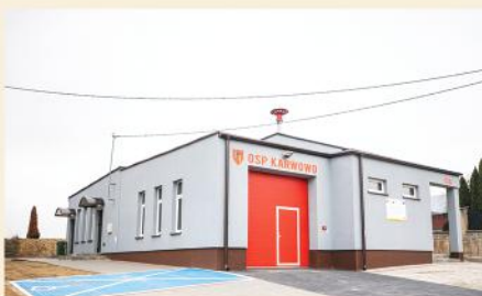
Remiza w Karwowie przed i po remoncie

Ponadto jednostki OSP wzbogaciły się o nowy sprzęt dzięki pozyskanym dotacjom Urzędu Marszałkowskiego Województwa Podlaskiego i z Ministerstwa Spraw Wewnętrznych i Administracji. Z Urzędu Marszałkowskiego Województwa Podlaskiego pozyskaliśmy 30 tys. zł. Za tę dotację dla OSP Stawiski zakupiony został zestaw ratownictwa drogowego, tj. zestaw narzędzi hydraulicznych (nożyczorozpieracz, pompa i wąż hydrauliczny). Ze środków KSRG jednostka OSP Stawiski pozyskała 5.500,00 zł na remont posadzki w garażu oraz 7.400,00 zł na sprzęt uzbrojenia oraz wyposażenie osobiste i ochronne.