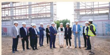
Wizyta Ministrów i przedstawicieli władz różnego szczebla na placu budowy hali sportowej w Stawiskach

Aby organizacja nauki zdalnej zarówno w roku szkolnym 2019/2020, jak i 2020/2021 przebiegała sprawnie skorzystaliśmy z rządowych programów „Zdalna Szkoła” i „Zdalna szkoła +”. W ramach pierwszego programu zakupiliśmy 19 laptopów za kwotę 60 tys. zł. W ramach drugiego programu dofinansowanie wyniosło 94.999,50 zł, dzięki czemu mogliśmy kupić kolejne 30 laptopów.