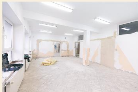
Podpisanie umowy i rozpoczęte prace remontowe pomieszczeń CUS

Ośrodek Pomocy Społecznej w Stawiskach w 2020 roku miał wyjątkowo dużo pracy. Mimo często utrudnionego kontaktu z interesantami – co wymuszała troska o zdrowie, ale też przepisy wprowadzane na czas walki z pandemią, pracownicy OPS wykonywali swoje zadania oraz wszelkie dodatkowe obowiązki związane z pomocą osobom starszym, czy w kwarantannie. Kolejny już raz realizowaliśmy Wieloletni Program Rządowy „Posiłek w szkole i w domu”. W ramach tego wsparcia od stycznia do czerwca 2020 r. ciepły posiłek trafiał do uczniów szkół i przedszkola, jak również do innych osób. Program realizowany był również w terminie od września do grudnia 2020 r. Realizowaliśmy także projekt ze środków RPO WP pn. „Sąsiedzkie usługi opiekuńcze”, dzięki któremu wsparcie usług opiekuńczych, psychologa, fizjoterapeuty czy dietytyka dotarło do najbardziej potrzebujących, niesamodzielnych mieszkańców Naszej Gminy.