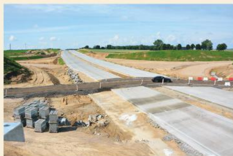
Droga nr 61 w przebudowie

Zakończył się remont ponad 2,3 km drogi powiatowej Dzierzbia – Zaskrodzie, który był możliwy dzięki dobrej współpracy z Powiatem Kolneńskim. To inwestycja dofinansowana z budżetu Gminy Stawiski, Powiatu Kolneńskiego i Funduszu Dróg Samorządowych.