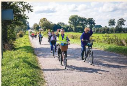
Uczestnicy rajdu rowerowego