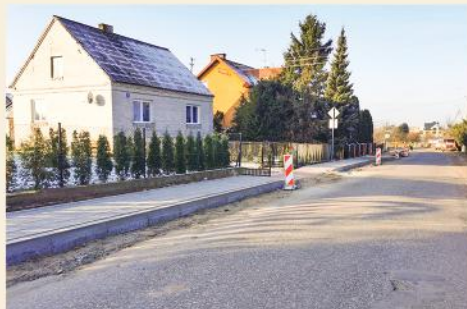
Trwa budowa chodnika przy drodze wojewódzkiej nr 648 w Porytem

Trwają prace przy drodze krajowej nr 61, dlatego zamknięty jest wjazd do Stawisk od ul. Łomżyńskiej. Utrudnienia w związku z tymi pracami potrwają do 31 lipca 2021 roku.