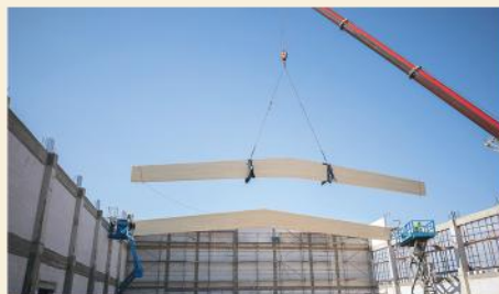
Postęp prac na budowie hali sportowej w Stawiskach