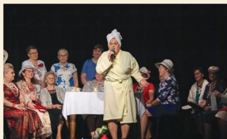
Dzień Kobiet w Stawiskach