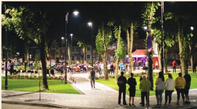
Park w Stawiskach - biesiada na zakończenie wakacji

W sobotę 29 sierpnia 2020 roku w Parku w Stawiskach odbyło się wakacyjne biesiadowanie.