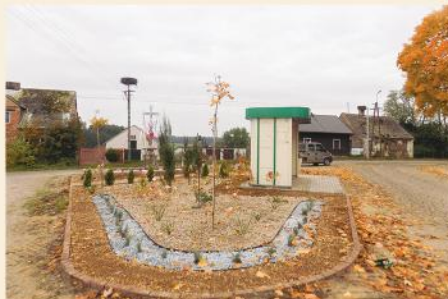
Skwery w Stawiskach i Romanach

Udało się uregulować kwestie związane z zalewem. Z Wód Polskich otrzymaliśmy potwierdzenie, że jest to własność samorządu gminnego, więc teraz będziemy mogli odpowiednio zadbać o wygląd i funkcjonalność tego miejsca tak, by było atrakcyjne zarówno dla mieszkańców Naszej Gminy, jak i turystów oraz wędkarzy. Przygotowania odpowiedniej dokumentacji trwają.