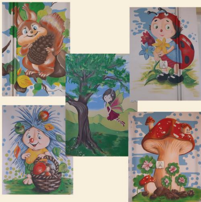
Bajkowe postacie w Przedszkolu w Stawiskach